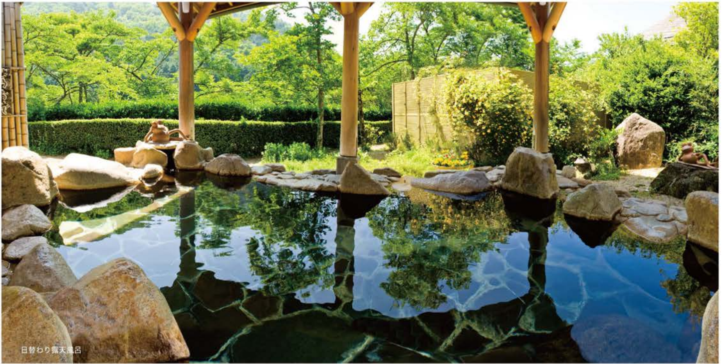
日替わり露天風呂