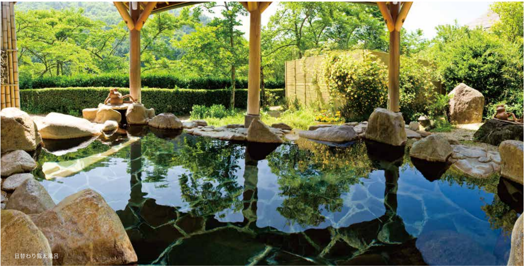
日替わり露天風呂