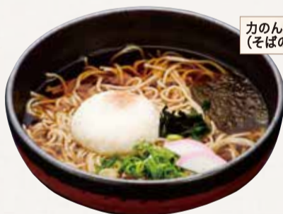
力のんたそば (そばの実入り餅)

季節感や栄養バランスを考えた献立の配食サービス。高齢者の安否を確認するサービスも付いています。毎日飽きずに召し上がっていただけるよう、家庭の味を大事にしています。