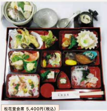
松花堂会席 5,400円(税込)