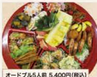
オードブル5人前 5,400円(税込)