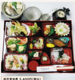
松花堂会席 5,400円(税込)

温泉のほとりを流れる清流・波川の恵み ヤマメと香り豊かなアユ。冬の味覚は旨 みたっぷりの「しし鍋(予約制)」。無農薬 栽培からそば打ちまでを自社で行う、自 家製「のんたそば」。鹿野ならではの旬の 食材をふんだんに使った、身体にやさし い手料理を、心ゆくまで堪能ください。 各種宴会、仕出し料理 お弁当、配食サービスも 承ります。