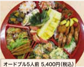
オードブル5人前 5,400円(税込)