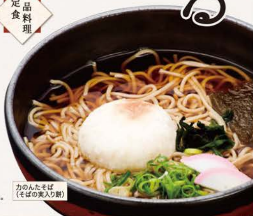
力のんたそば (そばの笑入り餅)